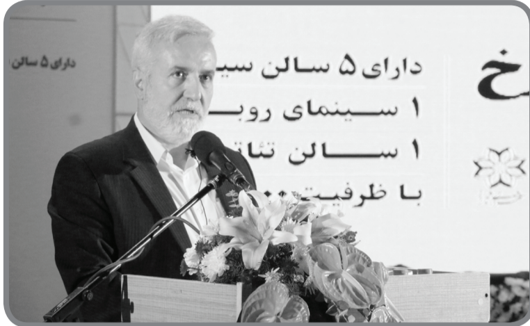
شهردار کلان‌شهر شیراز مطرح کرد:

رئیس شورای اسلامی شهر شیراز با اشاره به اینکه بازار بزرگ پروتئین زمانی از طریق اوراق مشارکت ساخته شد و در حال حاضر اعتبار آن بیش از ۳ هزار و ۵۰۰ میلیارد تومان است، خاطرنشان کرد: در این مسئله باید کمک شود تا با همکاری شهر شیراز آن‌طور که شایسته مردم است، بسازیم و اگرچه این پروژه‌ها شایسته مردم شیراز بود اما شایستگی مردم بیشتر است.