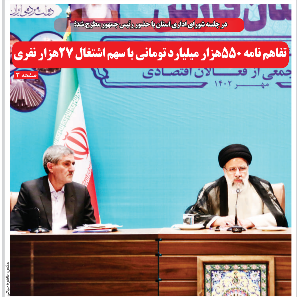
در جلسه شورای اداری استان با حضور رئیس‌جمهور مطرح شد

معاون توسعه مدیریت و منابع استانداری فارس خبر داد: تحقق ترمیم و افزایش حقوق کارکنان وزارت کشور