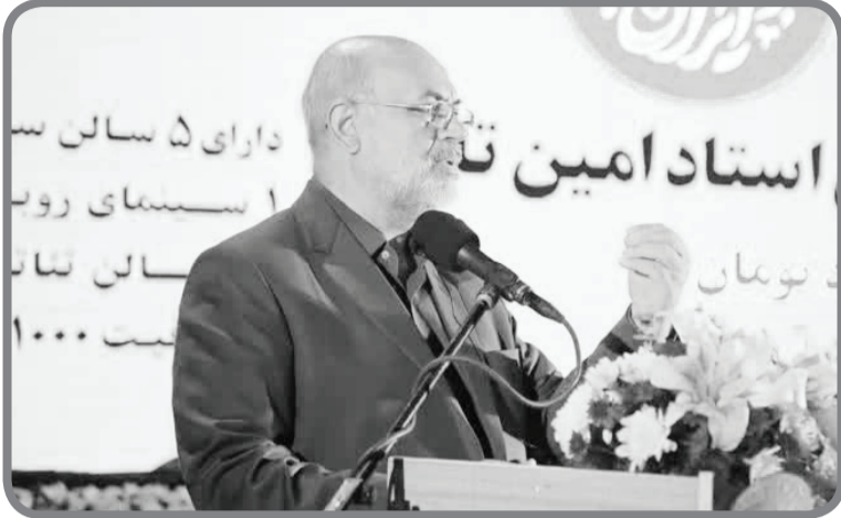
رئیس شورای اسلامی شهر شیراز بیان کرد: