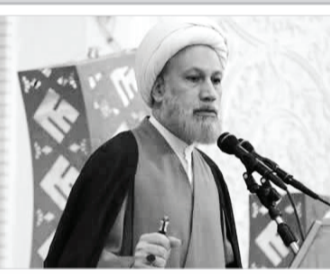
نماینده ولی‌فقیه در فارس و امام‌جمعه شیراز

آیتا... رئیس‌ی افزود: با بهترین استفاده از آب و خاک و صنعت به دست نیروی انسانی توانمند می‌توانیم به هدف برسیم.