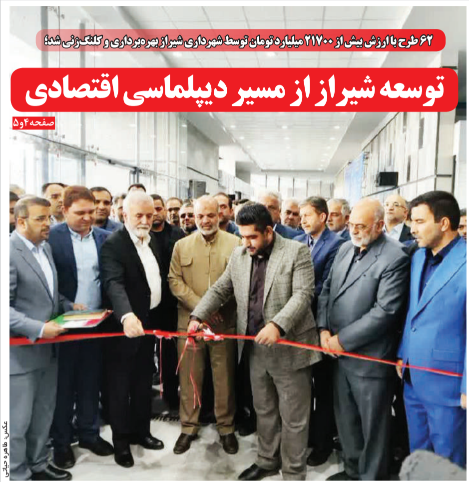
۶۲ طرح با ارزش بیش از ۲۱۷۰۰ میلیارد تومان توسط شهرداری شیراز بهره‌برداری و تکمیل شد

رئیس دولت سیزدهم مسئولی ساده زیست، تلاش‌گر، دارای مواضع ضد فساد اداری، فردی انقلابی و روحیه جهادی است و هیئت دولت سیزدهم نیز در بعد اقتصادی با وجود مشکلات و موانع خدمات خوبی را در کشور انجام داده‌اند اما همانطور که می‌دانیم آنچه خواسته مردم است رشد در مسائل ساختاری کشور دارد و این موضوعی است که شاید آنچه‌ای که باید به مذاق مردم خوش نیاید مردمی که هم چنان در انتظار دیدن نتایج اقدامات دولت در زندگی روزمره‌شان هستند.