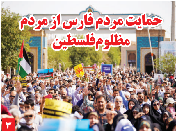
حمایت مردم فارس از مردم مظلوم فلسطین