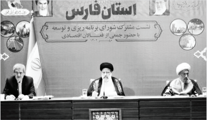
اعضای هیئت مدیره شرکت گاز فارس

آن بخش اعظم پروژه‌های نیمه‌تمام فارس تکمیل و در اختیار مردم قرار گیرد. نماینده ولی‌فقیه در استان فارس و امام‌جمعه شیراز نیز در ادامه این نشست با اشاره به وضعیت یافت تاریخی و قدیمی شیراز گفت: اقداماتی اخیراً با تلاش مدیریت شهری شیراز و دستگاه‌های متولی انجام شده و کلنگ‌زنی خط چهار مترو شیراز که ۲۱ مهرماه در سفر هیئت دولت به این استان انجام شد دسترسی به حرم مطهر شاهچراغ را تسهیل خواهد کرد. آیتا... دژکام درخواست سامان‌دهی و به‌سازای یافت قدیم شیراز را با توجه به حفظ میراث فرهنگی این منطقه مطرح کرد.